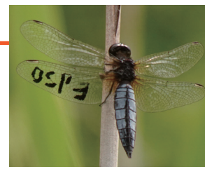
ハラピロトンボ♂ (本牧市民公園)