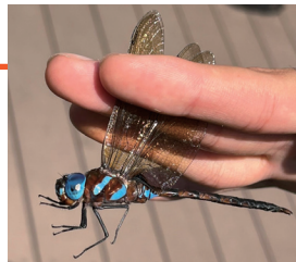
マルタンヤンマ♂ (根岸森林公園)

マルタンヤンマの雄を初めて捕獲しました! また、3種のトンボを20年間の調査の中で初めて捕獲しました。ミルンヤンマ以外はすべて雄です。