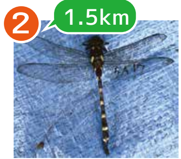
2 1.5km 5A17 オニヤンマ ♂ 8/15 富岡総合公園で捕獲→ 8/28 杉田(民家)で再確認