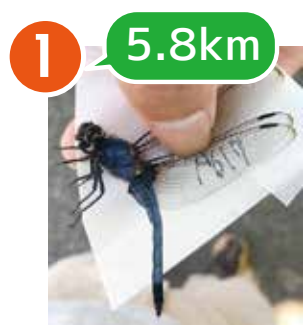
1 5.8km A617 オオシオカラトンボ ♂ 6/26 富岡総合公園で捕獲→ 6/27 野島公園で再捕獲

今年もトンボに番号を書いて、どこからどこまで飛んだのかを調べました！小さなカラダにこんなパワーがあるなんてスゴイね！