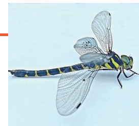
ミルンヤンマ♀ (富岡総合公園)