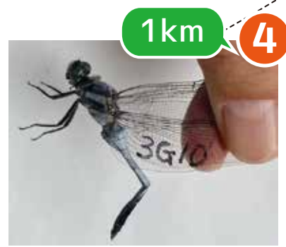
4 1km 3G10 シオカラトンボ ♂ 8/23 高田池で捕獲→ 9/3 ミツ池公園で再捕獲