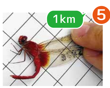
5 1km 3S42 ショウジョウトンボ ♂ 8/3 ミツ池公園で捕獲→ 8/20 ニツ池で再捕獲