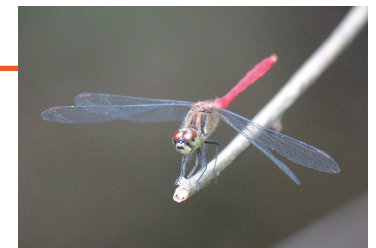
マユタテアカネ♀ ニツ池 (なんと4頭捕獲)