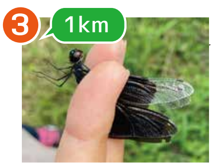
3 1km IS69 チョウトンボ ♂ 8/1 ミツ池公園で捕獲→ 8/20 ニツ池で再捕獲